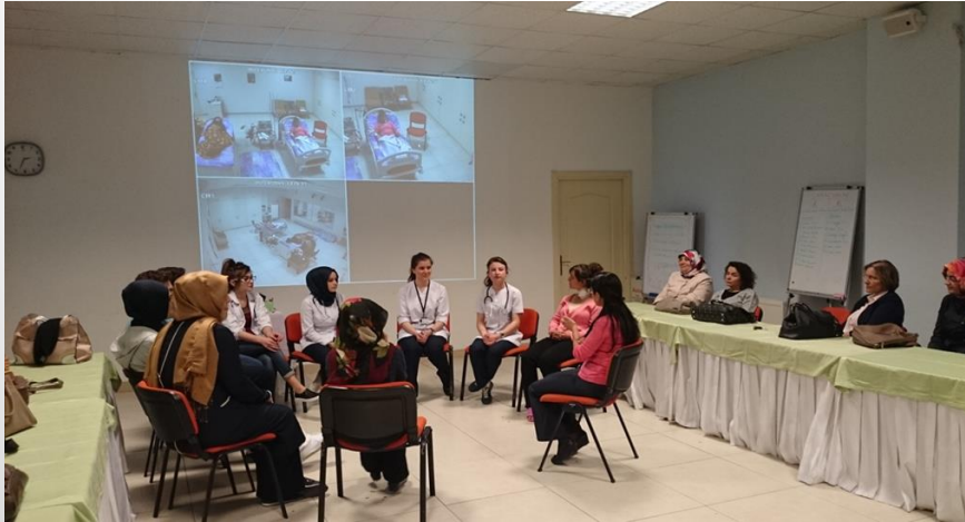
2018-2019 EĞİTİM-ÖĞRETİM YILI GÜZ DÖNEMİ AKADEMİK GENEL KURUL TOPLANTISI